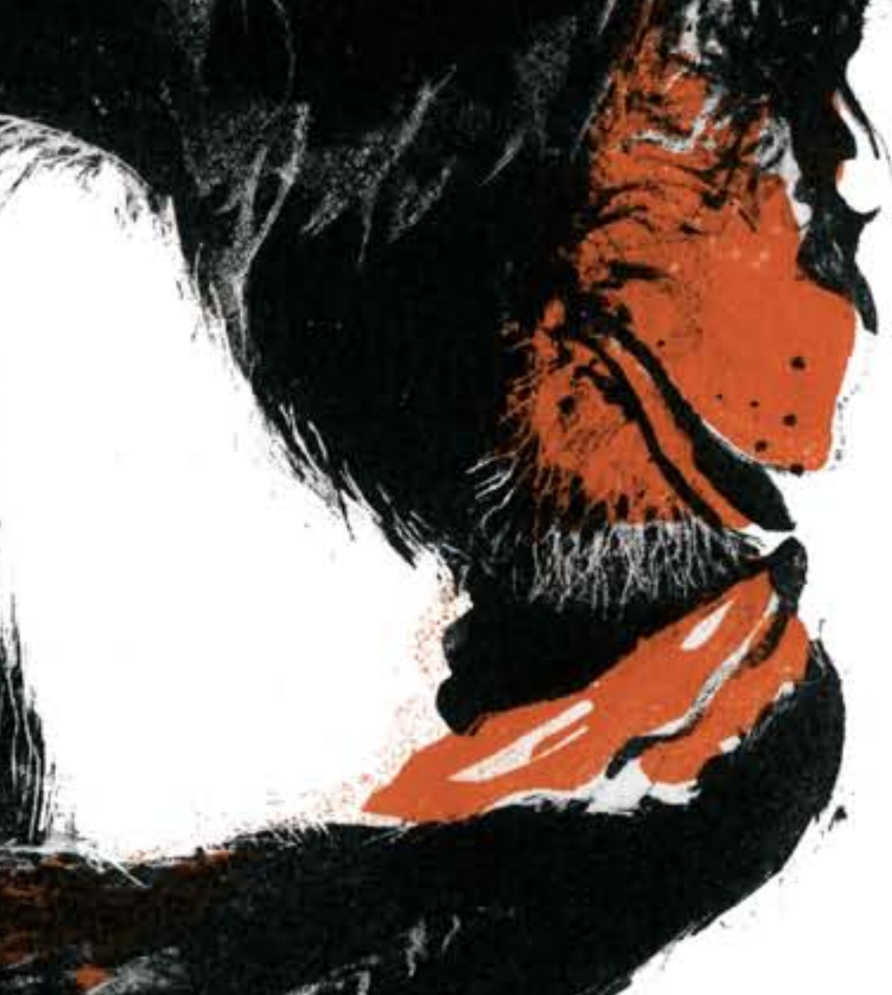
Image du Destin, immobile, effrayant. Chercher l'issue et s'extraire comme Dédale vers d'autres conditions.

Elle raconte la course des saisons comme la mer, celle des vents, incertaine. Les routes, éphémères, parfois s'y rejoignent.